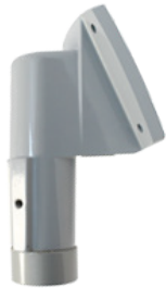
PUNTA DE POSTE 25° CON ADAPTADOR ROSCADO HZCAS25SUPPORT