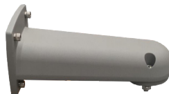
BRAZO PARA MURO HZCASMARM