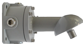
BRAZO A MURO A 25° HZCAS25ARMJBOX