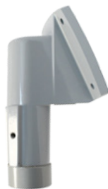
PUNTA DE POSTE 25° CON ADAPTADOR ROSCADO HZCAS25SUPPORT