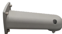
BRAZO PARA MURO HZCASMARM