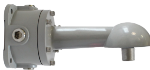
BRAZO PARA MURO A 90° HZCAS90ARMJBOX