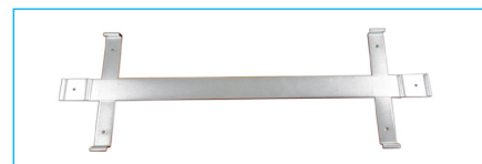
COD. 3504 Accesorio para montaje a muro